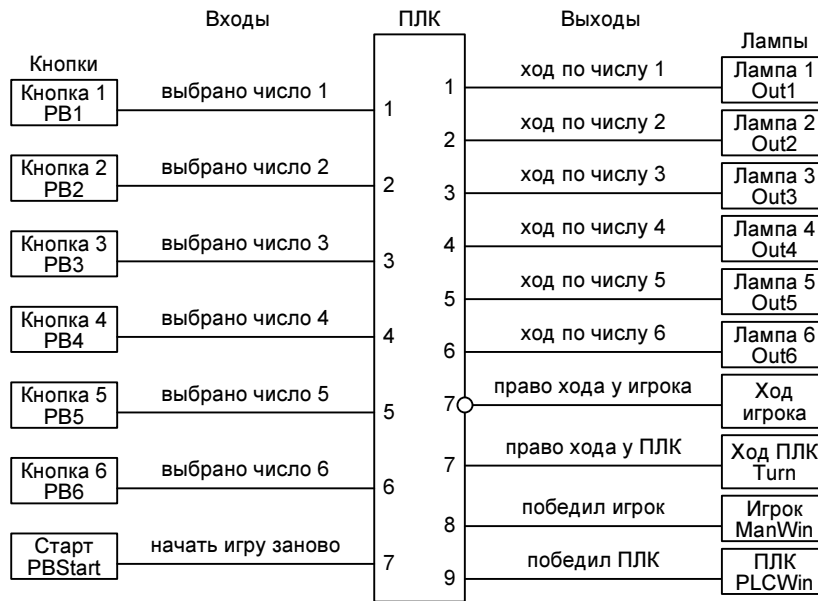
Рис. 1. Панель управления и интерфейс ПЛК управления игрой «31»

На рис. 1 изображена схема панели управления игрой. Кнопки «1», «2», «3», «4», «5» и «6» используются для «переворачивания» соответствующей карты. Нажатие кнопки является некорректным и не засчитывается, если она была нажата одновременно с другой кнопкой. В этом случае она должна быть отжата и затем нажата корректно. После корректного нажатия одной из этих кнопок соответствующее значение на «Дисплее карт» уменьшается на единицу. В исходном состоянии каждый из этих дисплеев отображает цифру 4. Снизу значения, отображаемые дисплеем, ограничены 0. После каждого хода игрока и/или ПЛК сумма значений «перевернутых» карт отображается на «Дисплее суммы». Для удобства визуального восприятия игры после хода игрока должна происходить задержка хода ПЛК на две секунды (в течение которых ПЛК «думает»).